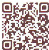
臺北地政雲地價查詢

我們還提供平方公尺及坪之單位換算服務喔！這麼棒的功能還等什麼？歡迎至臺北地政雲地價查詢頁面 ( https://cloud.land.gov.taipei/ImmPrice/LandPrice.aspx ) 親自操作體驗。