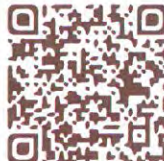
不動產動態報導專區