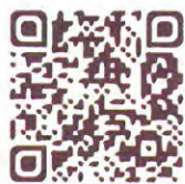
社區交易履歷查詢

透過觀察同一社區累積之實價登錄案例，提供小區域房價水準參考，輕鬆掌握不動產價量變動趨勢，除提供百戶以上大社區交易履歷，特別新增百戶內社區以圖台框選或門牌定位方式查詢功能。另外針對大社區還提供主動通知功能，加入地政雲會員便享有追蹤社區成交案件的 E-mail 通知服務唷！