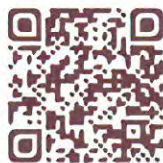
臺北市熱門路段房價 & 租金索驥