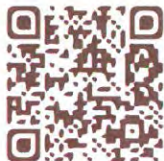
臺北地政雲實價登錄查詢專區